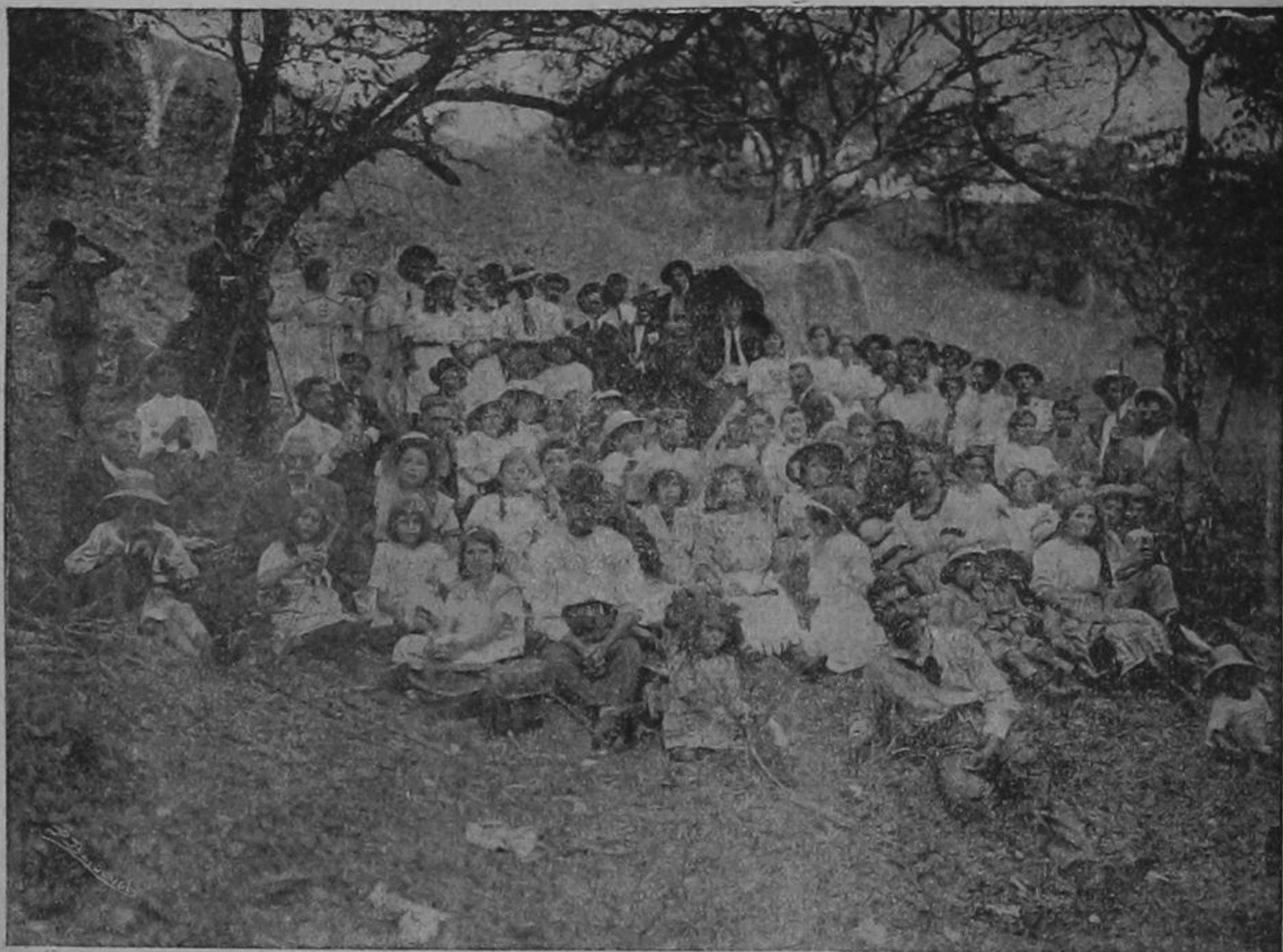
Los paseantes después de almorzar a orillas del río